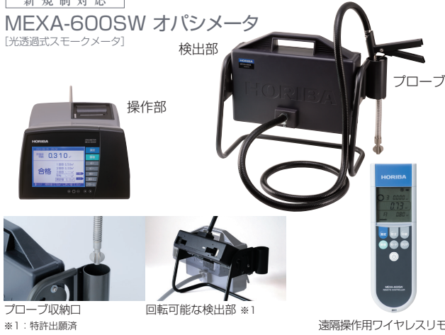
プローブ収納口 ※1: 特許出願済